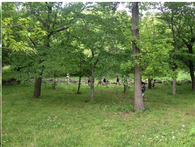
森を探索。。。新緑の中、制服姿が良く似合うね！指示書を良くチェックして見落とさないように