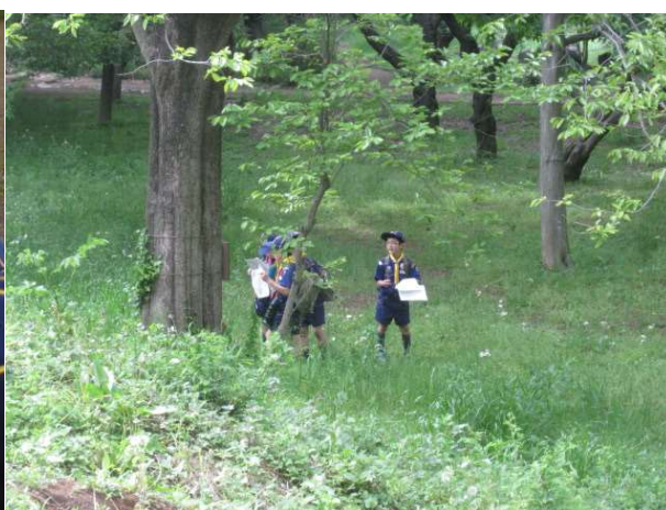
↑この足元から追跡サインがスタートします。サインを見落とすな。