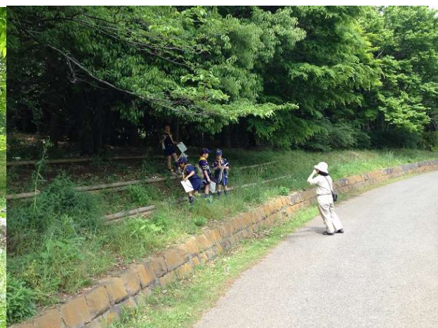
見事、サインをたどり目的の指示を発見、お〜い、指示書にこんなコースはないぞ...